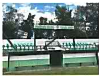
Az éjjeli vihar okozta károk - Škody po nočnej búrke 2019.8.8.

Ideiglenes esőkabát a lelátón -Dočasný pršíplášť na tribúne